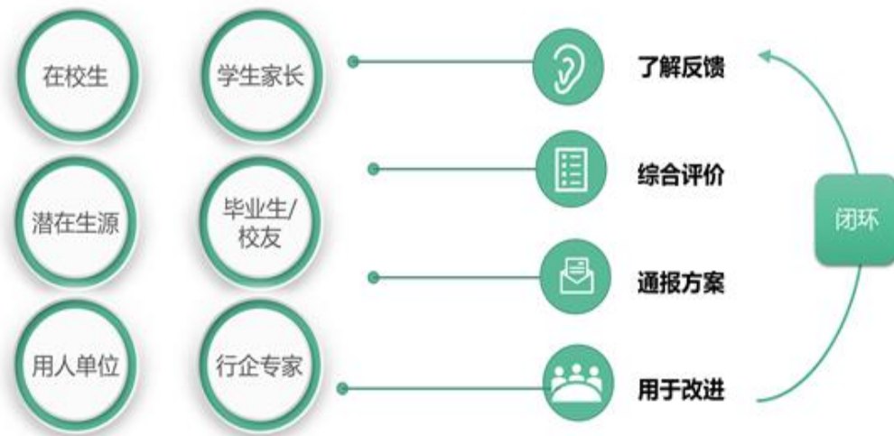
学生发展中心（SDC）的内外联动与教学质量持续改进示意图

（2）建立学业预警制度。根据学生重修或补考课程门数，设立红、黄、蓝三级预警制度，并及时向家长反馈具体信息；